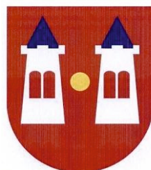
Taki herb mamy

Herb miasta Płońska przedstawia dwie wolnostojące blankowane wieże z zaznaczonymi wejściami, ze spiczastymi dachami, które zakończone są małymi kulami; pomiędzy wieżami duża kula; wieże posiadają charakterystyczne ukośne elementy konstrukcji sugerujące ich drewniany charakter. Tarcza herbowa jest barwy czerwonej, wieże i kuliste zwieńczenia wież barwy czarnej, wejścia do wież i elementy